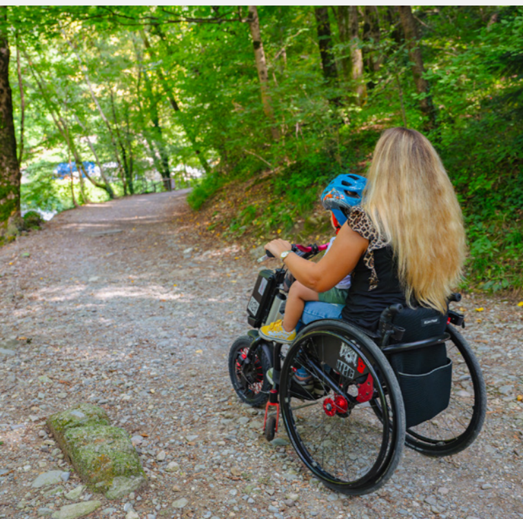
Percorsi pianeggianti, natura rigogliosa e relax per tutti.